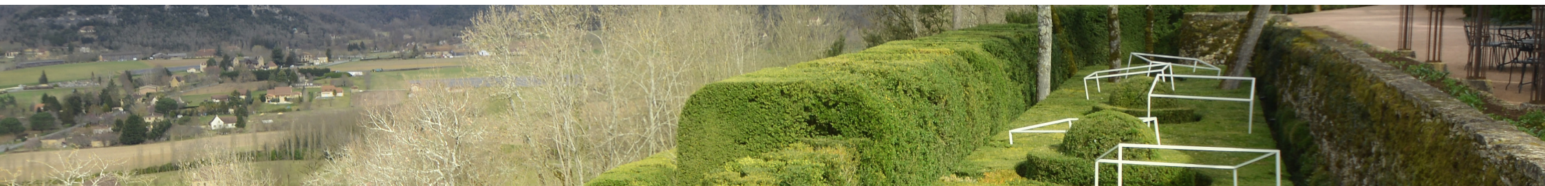
Icebergs - Anamorphic Furniture / re.riddle gallery / Les Jardins suspendus de Marqueyssac Dossier de presse / press kit